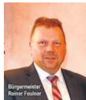
Bürgermeister Reiner Feulner