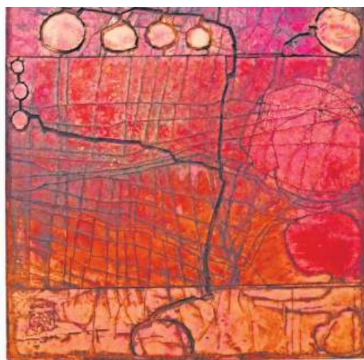
Gerd Kanz, Kiss me over the garden gate, 2020, Öl auf Holz, 80 x 80 cm.

Einmalig und unverwechselbar ist das Werk des unterfränki-