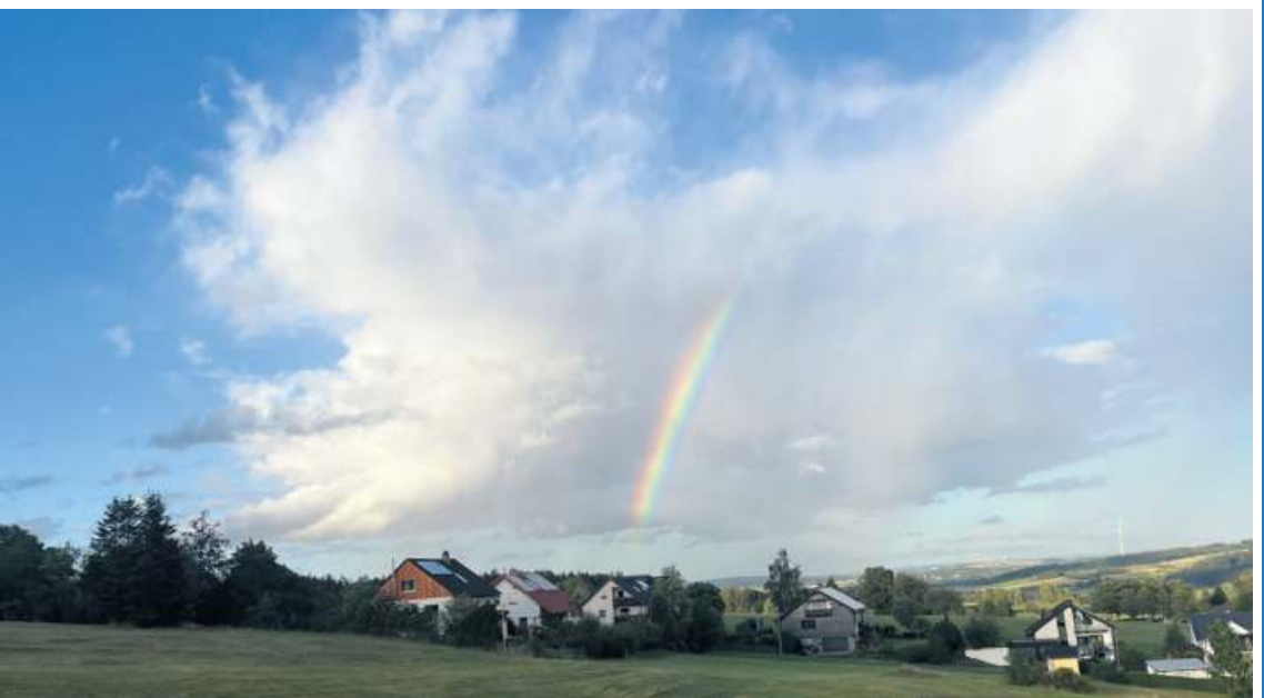
... fotografiert von WIR-Leserin Sylvia Mahall.