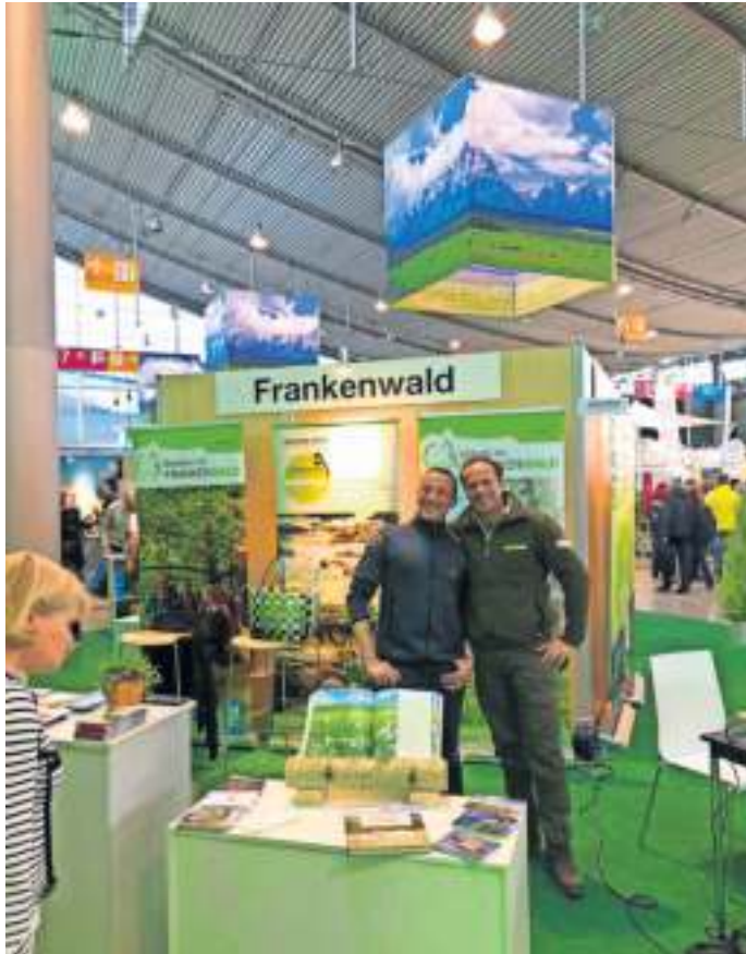
Der Messestand auf der CMT in Stuttgart.