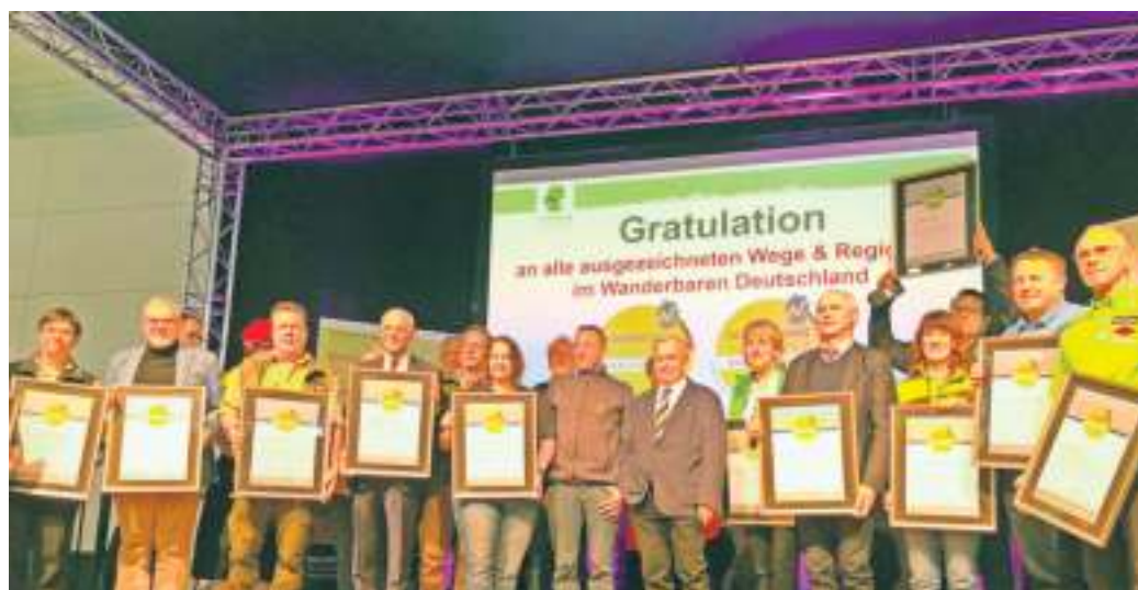
er Frankenwald erhielt erneut das Prädikat zur Qualitätsregion Wanderbares Deutschland.

29.01.), die Internationale Tourismus-Börse (ITB) in Berlin (07.03. - 09.03.) sowie die Frankenbus-Aktionen in „Hessen/Rheinland-Pfalz“ mit den Städten Mainz, Darmstadt, Wiesbaden, 2 x Frankfurt (17.04. – 21.04.), in „Sachsen-Thüringen“ mit den Städten Leipzig, Gera, Jena, Weimar, Erfurt (08.05. – 12.05.) und in „Baden-Württemberg“ mit den Städten Stuttgart, Karlsruhe, Heilbronn, Ulm und Reutlingen (10.07. – 14.07.) auf dem Tourplan.