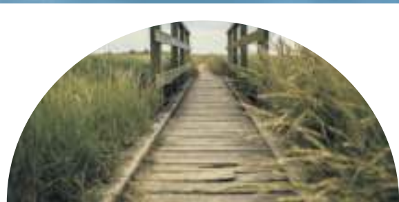
STRASSDORF, IM JANUAR 2023

Eintrittskarten gibt es zum Preis von 15 Euro (ermäßigt 12 Euro) im Vorverkauf in der Bücherstube an der Martinskirche, St. Martin Str. 17, 91301 Forchheim, Telefonnummer 09191 14500 und an der Abendkasse.