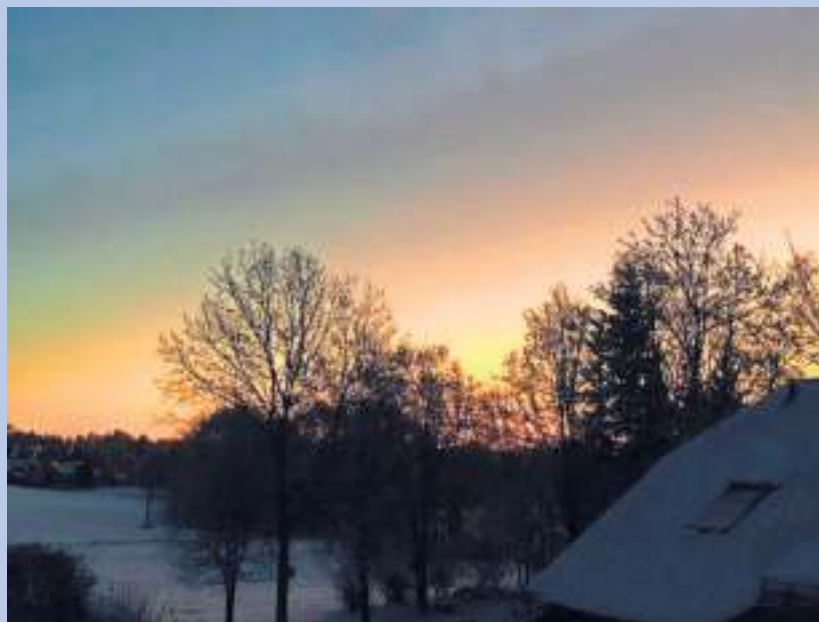
Ein frostiger Wintermorgen