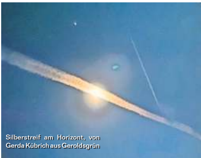
Silberstreif am Horizont, von Gerda Kübrich aus Geroldsgrün