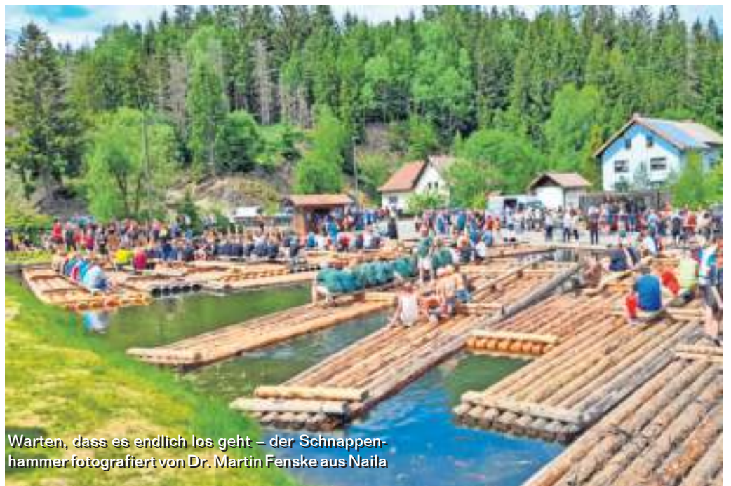
Warten, dass es endlich los geht – der Schnappenhämmer