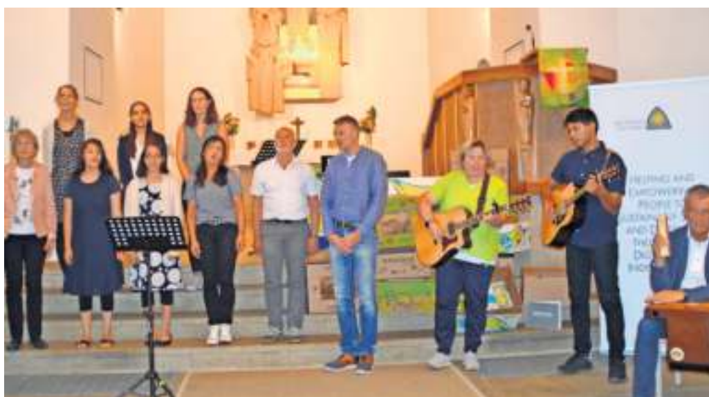
Musikalisches beim Festgottesdienst