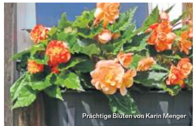
Prächtige Blüten von Karin Menger