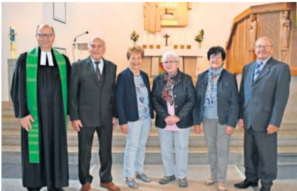
Nach 60 Jahren trafen sich die Diamantenen Konfirmanden zum Festgottesdienst