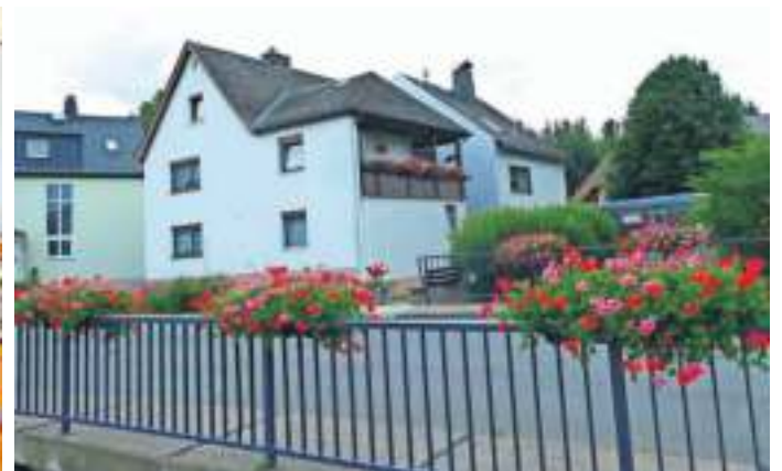
Hier waren die Gartenfreunde im Einsatz: Ein Foto der gepflegten Blumenkästen an der Brücke.

der Zukunft, die eine oder andere schmerzliche Veränderung in der bisherigen Vereinswelt erleben“, bilanzierte der Bürgermeister und auch, dass es immer schwieriger sei, Vorstände für ein Ehrenamt über Jahrzehnte hinweg zu finden. „Die nachhaltige, langjährige Ehrenamtsübernahme wird weniger.“ Stumpf appellierte und motivierte, dass Beste aus der Situation zu machen und die Flinte nicht ins Korn zu werfen. „Sie verschönern ihren Heimatort nicht nur