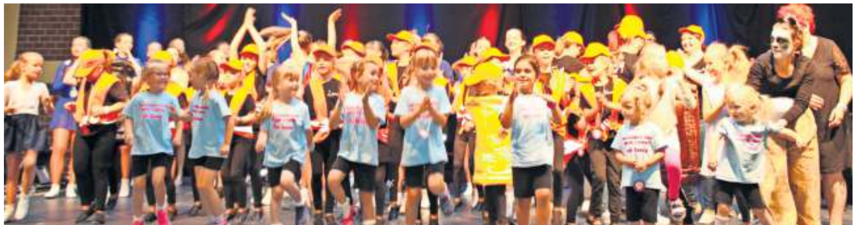
Bei einem tollen Finale kamen nochmals alle 120 Tänzerinnen und Büttensprecher auf die Bühne und holten sich den verdienten Applaus für eine durchwegs gelungene dreistündige Show mit einem gemeinsamen Tanz, der dann mit einer langen Polonaise durch den Saal endete.