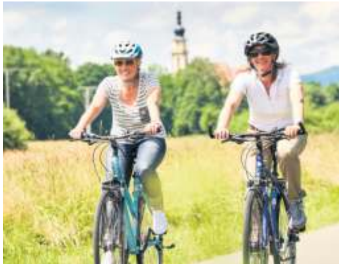
Nach der Premiere im Vorjahr findet die Aktion „24 Stunden Frankenwald“ erleben auch 2022 statt.

Und das Schöne dabei ist, sie können sich ihr Wunschprogramm vorab selbst im Internet zusammenstellen und dabei aus einem bunten Potpourri aus sehens- und erlebenswerten Erlebnismöglichkeiten verteilt über den gesamten Frankenwald wählen. Eine Vorreservierung ist erforderlich, denn die Teilnehmerzahlen sind teilweise begrenzt. Schnell sein lohnt sich