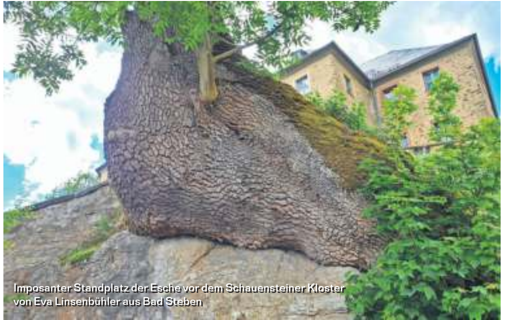
Imposanter Standplatz der Esche vor dem Schauensteiner Kloster von Eva Linsenbühler aus Bad Steben