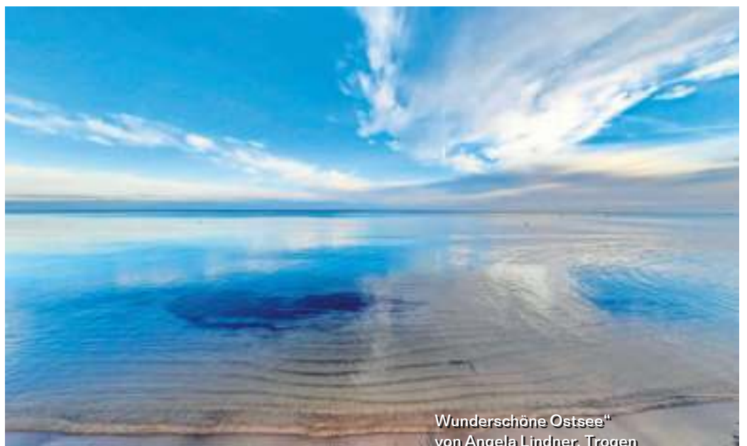
Wunderschöne Ostsee“ von Angela Lindner, Trogen