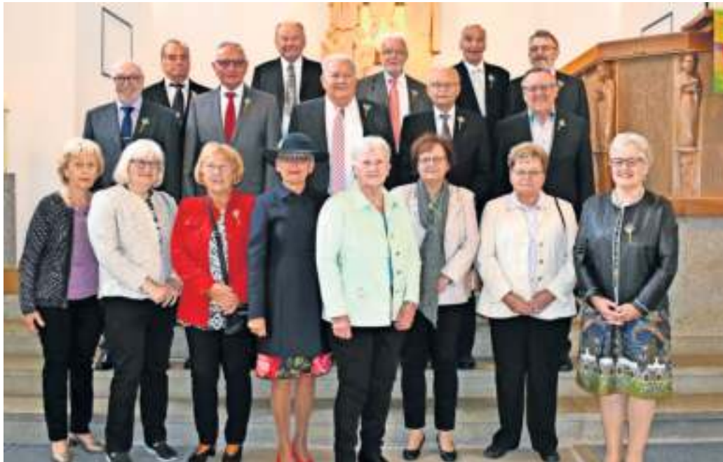
Die Gnadenen Konfirmanden erinnern sich gemeinsam an ihre Konfirmation vor 70 Jahren