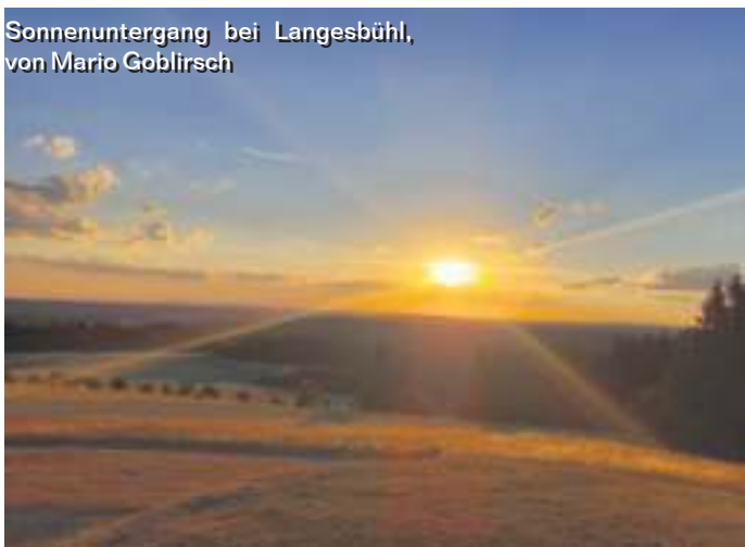
Sonnenuntergang bei Langesbühl, von Mario Goblirsch