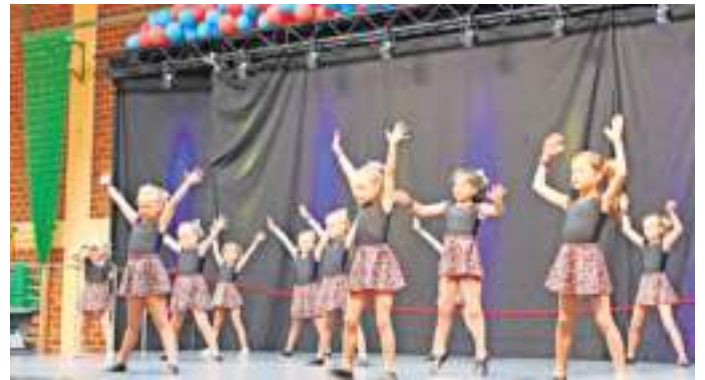
Die Minigarde der Karnevalsabteilung begeisterte mit ihrem flotten Schautanz die vielen Gäste beim „Sommer Dance Comeback“ in der voll-nailaer Frankenhalle.

Lippertsgrün – Obwohl der Trainingsbetrieb der Aktiven unverändert weiter ging, war es in den letzten beiden Jahren in der Öffentlichkeit etwas ruhiger geworden um die Karnevalsabteilung des TuS 02 Lippertsgrün. Prunksitzungen, Turniere und so mancher Spaß mussten in der „fünften Jahreszeit“ ausfallen. Um den Kids aller Garden dennoch die Möglichkeit eines Auftritts auf einer großen Bühne zu bieten, entschlossen sich die Karnevalisten ein Sommer Dance Comeback in einer eher ungewohnten Jahreszeit stattfinden zu lassen.