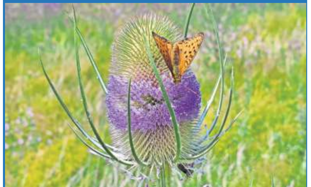
Eine Wilde Karde hat Besuch von einem Perlmutterfalter, fotografiert von Eva Maria Horn