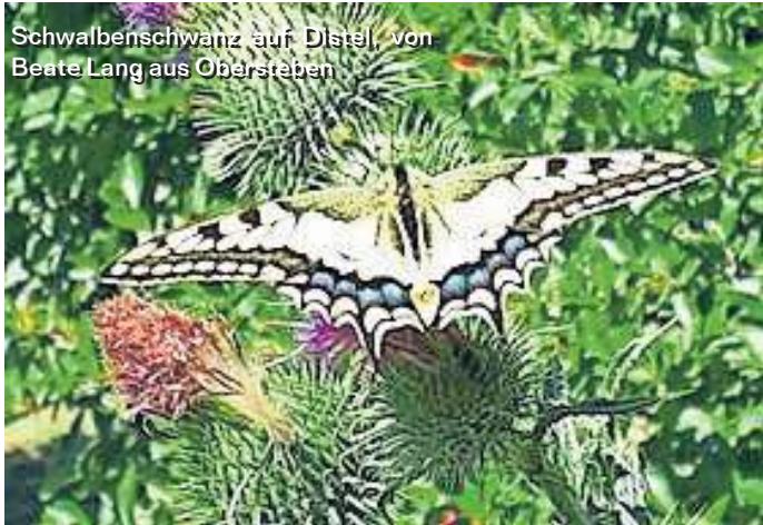
Schwalbenschwanz auf Distel, von Beate Lang aus Oberstaben

Die WIR-Redaktion bedankt sich für die vielen beeindruckenden Bilder, die Sie uns an die E-Mail-Adresse redfrankenwald@kurier.de schicken. Auf dieser Seite präsentieren wir einige der Bilder, die es bislang noch nicht ins Blatt geschafft haben.