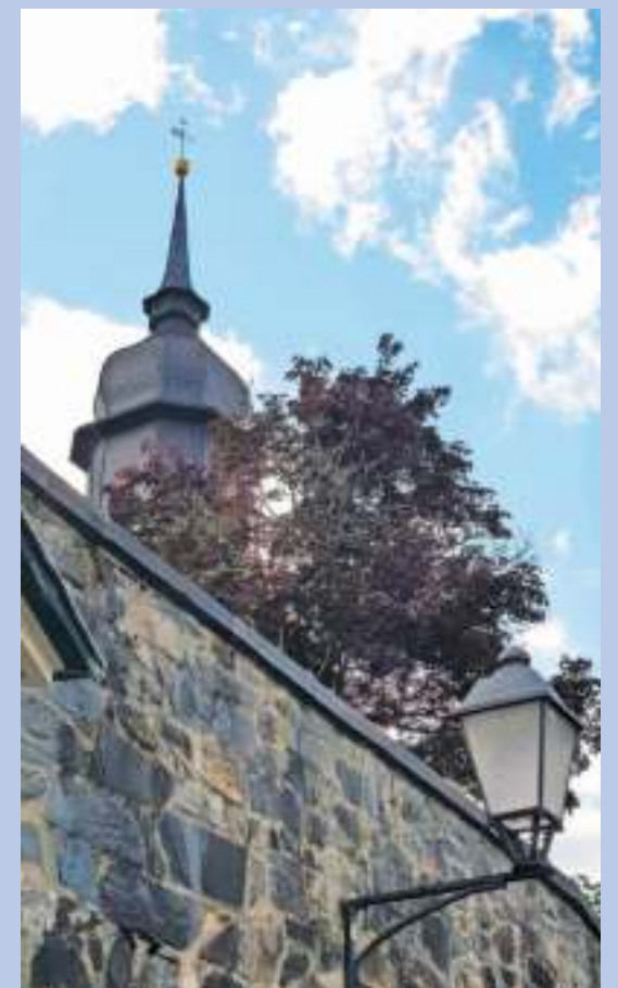
Die Jakobus Kirche Geroldgrün