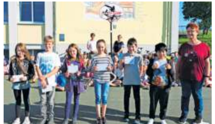
Die Antolin-Leseratten wurden mit Gutscheinen geehrt.