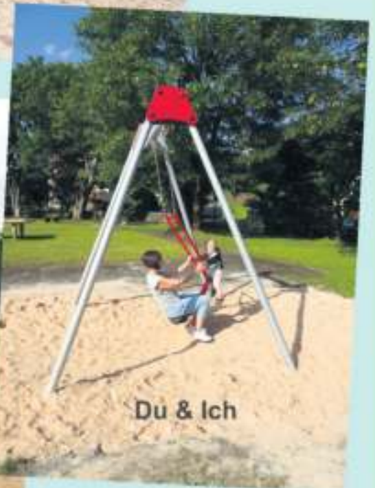
Du & Ich