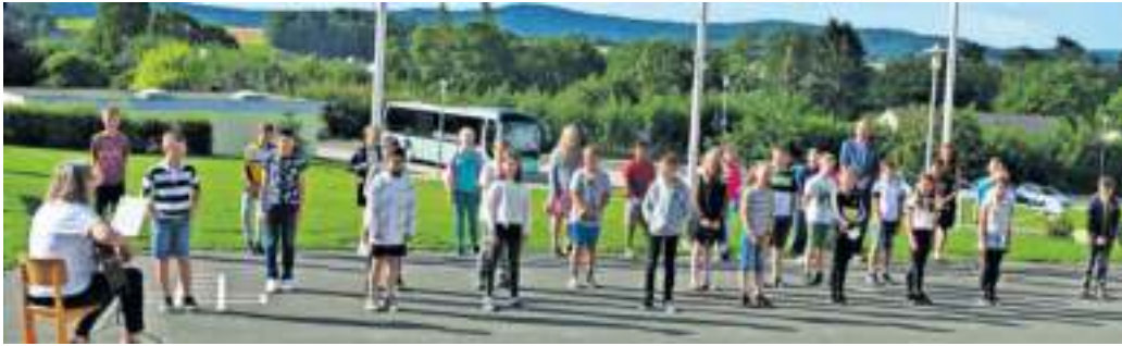
Der letzte Schultag für 27 Viertklässler.