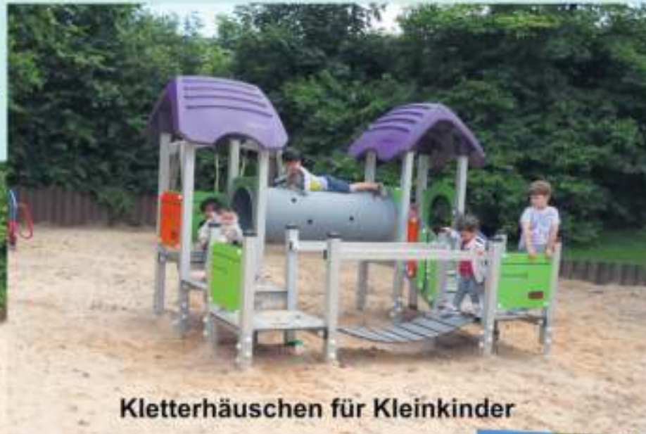
Kletterhäuschen für Kleinkinder

Die Stadt Schwarzenbach a.Wald hat einige neue Spielgeräte an den Spielplätzen Nordstraße und Peunthe in Schwarzenbach a.Wald und in Straßdorf aufgestellt.