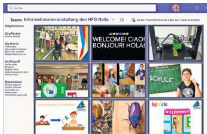
Virtueller Einblick ins vielfältige Lehrprogramm.