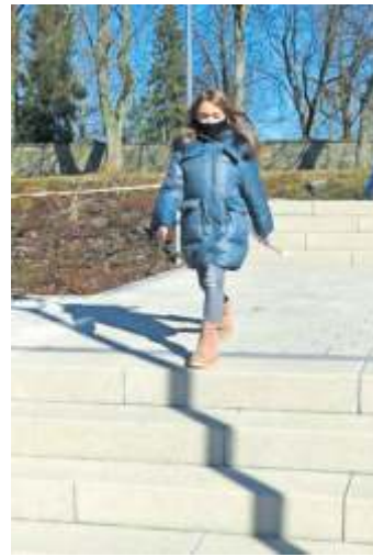
Wie viele Treppenstufen gibt es an der Grundschule?