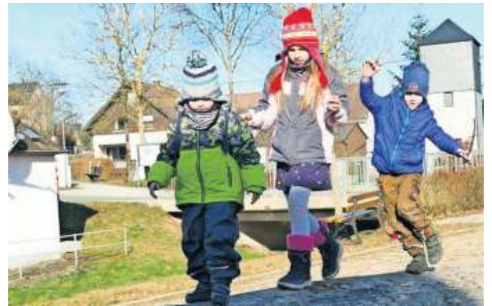
An dieser Station ist Balance gefragt

Highlight, auch die Kinder, die momentan die Einrichtung leider nicht besuchen können, gibt's nun eine Dorfrallye. Für die Teilnahme einfach einen Laufzettel