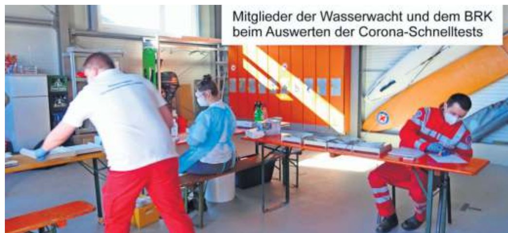
Mitglieder der Wasserwacht und dem BRK beim Auswerten der Corona-Schnelltests