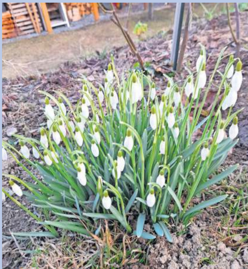
Erste Frühlingsboten im heimischen Garten