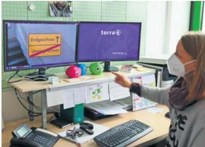
Das Foto zeigt die stellvertretende Schulleiterin der Muischen Realschule bei der Vorstellung des Films „Entdeckungstour durch die Schule“.