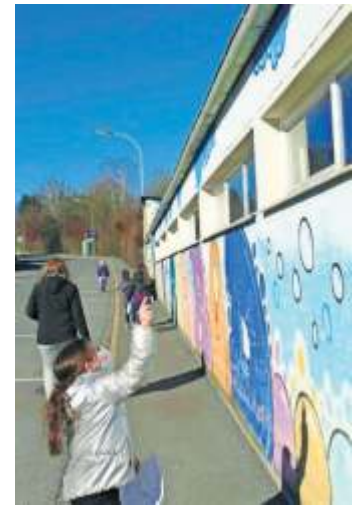
Eine knifflige Aufgabe: Wolken zählen am Freibad Naila.

Grundschüler an der Rallye teilgenommen haben. „Vor dem Haupteingang steht eine wasserfeste Box mit Laufzetteln und da hatten einige bereits ihren Spaß beim Mitmachen.“ Auch hatten die Außenorte die Teilnahme mit einem Eis to go beim Café Puccini verbunden.