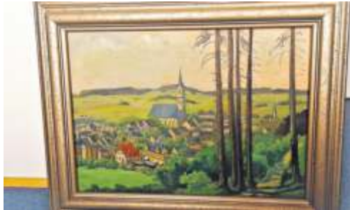
Naila in den 1920ern