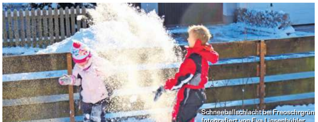
Schneeballschlacht bei Freoschrün