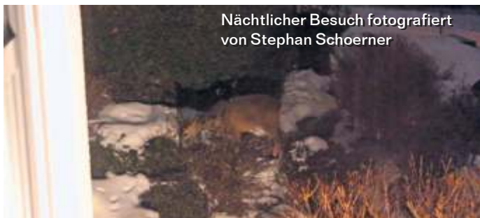
Nächtlicher Besuch