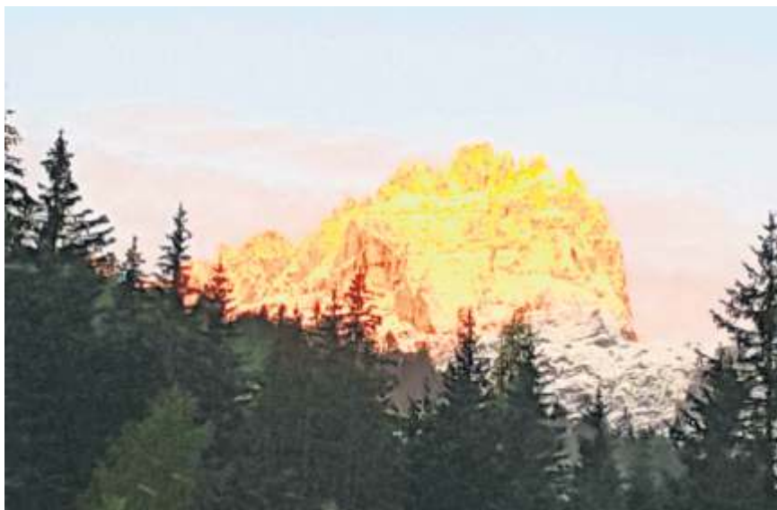
Die Dolomiten zum Sonnenaufgang, fotografiert von Renate Sawka aus Lichtenberg.