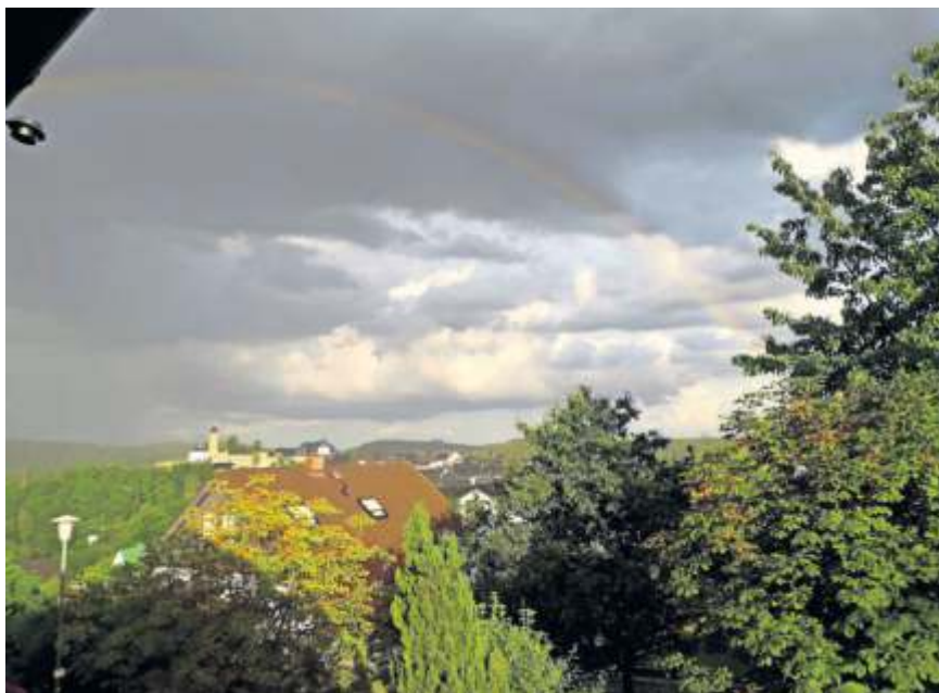
Regenbogen über der Lichtenberger Burg, fotografiert von Elke Rothballer aus Lichtenberg.