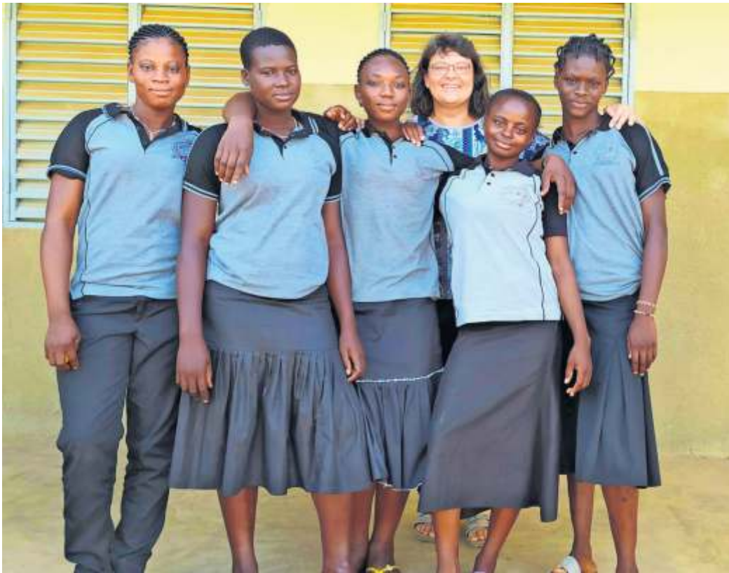
Schüler und Schülerinnen in Schuluniform.