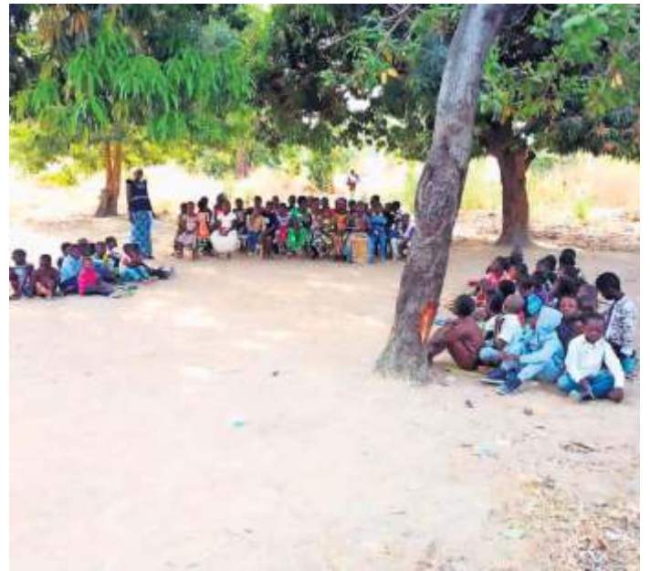
Kindergottesdienst unter Bäumen.

Hier werde ich nie den Status eines Einheimischen erreichen, da hindert mich schon meine Hautfarbe dran. „La blanche“, die Weiße, so werde ich hier bezeichnet, zumindest von den Leuten, die mich nicht kennen. Meine Freunde hier kennen meinen Namen, kennen meine Geschichte, teilen ihr Leben mit mir. Ich bin hier gut aufgenommen worden. Ich bin glücklich. Es gibt hier mehr als genug Arbeit für mich, vor allem in „meiner“ Schule. So bin ich hier in der „Fremde“, die mir jeden Tag mehr ein Stück Heimat wird.