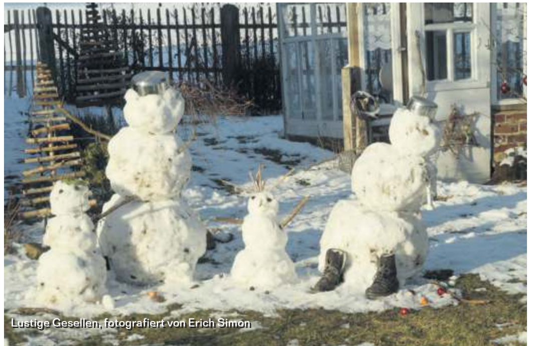
Lustige Gesellen