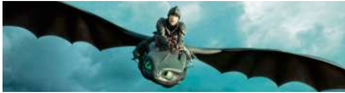
Eine Szene aus „Drachenzähmen leicht gemacht, Teil 3. Am 19. September wird der erste Teil beim Kinderkino gezeigt.

Nachdem die Schulturnhalle wieder für den Sportbetrieb zur Verfügung steht, beginnen mit dem Ende der Sommerferien auch die Übungsangebote des Turnvereins Berg im Innenbereich. Unter www.sportinberg.de sind die aktuellen Sportangebote nachzulesen. Der Sportbetrieb findet unter Einhaltung der Hygieneschutzkonzepte des TV Berg beziehungsweise der Gemeinde Berg statt. Alle Übungsleiter sind entsprechend unterrichtet, erklären die Hygieneschutzkonzepte zu Beginn der Übungsstunden und geben bei Fragen gern Auskunft. Das Mitbringen einer Mund-Nase-Bedeckung ist zwingend erforderlich, weil diese beim Betreten und Verlassen der Turnhalle beziehungsweise des Mehrzweckgebäudes, in den Umkleiden und beim Gang zur Toilette zu tragen ist. Kinder unter sechs Jahren müssen keine Mund-Nase-Bedeckung tragen. Oberstes Gebot ist die Einhaltung des Mindestabstands von 1,5 Metern zwischen den anwesenden Personen im In-