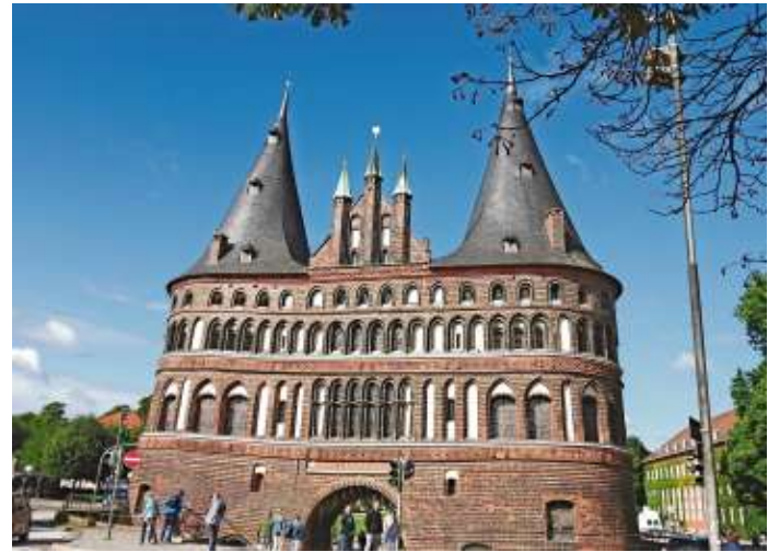
Alter Lübecker Hafen.