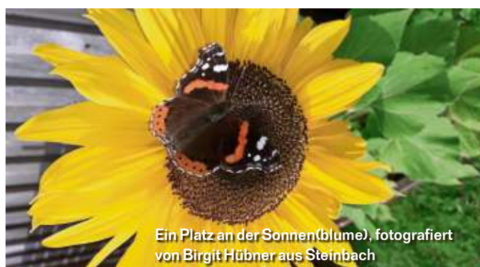
Ein Platz an der Sonnen(blume), fotografiert von Birgit Hübner aus Steinbach