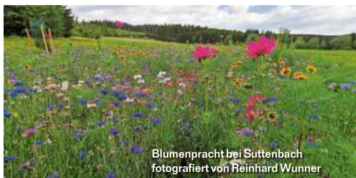
Blumenpracht bei Suttenbach