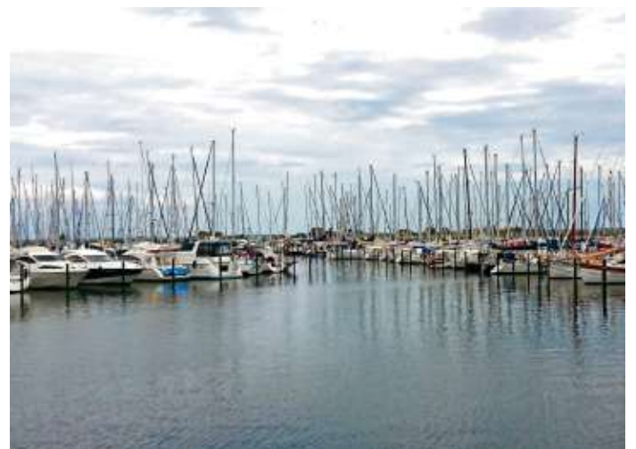
Mit der Bimmelbahn fahren die Teilnehmer der Reisegruppe in die Altstadt mit dem Jachthafen Heiligenhafen.

Türme“ genannt, sie gilt als Königin der Hanse. St. Marien zu Lübeck gilt als eines der Hauptwerke auf alle „Mutterkirchen“ der Backsteingotik. Die erhaltenen Bereiche der Lübecker Altstadt mit über tausend Kulturdenkmälern sind seit 1987 Teil des Unesco-Welterbes. Lübecker Marzipan wird seit dem späten Mittelalter in Lübeck hergestellt. Weitere Ausflüge führten zum Seebad Heiligenhafen und Seebad Grömitz. Heiligenhafen circa 9.200 Einwohner. Mit der Bimmelbahn wurde die Altstadt, mit Jachthafen und die 435 Meter lange Seebrücke besichtigt. Ein leckeres Fischbrötchen durfte da nicht fehlen. Der letzte Haltepunkt war das Seebad Grömitz, da seit 1813 Seebad und eines der ältesten an der Ostsee ist. Sehenswert war das Klosterdorf Cismar und die Seebrücke mit ihren 398 Metern Länge. Am Kopf der Brücke befindet sich eine im Jahr 2009 errichtete Tauchgondel für Touristen. Der Dank der Teilnehmer ging