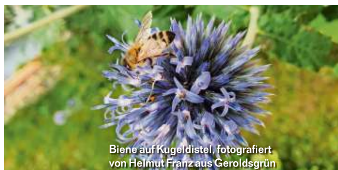
Biene auf Kugeldistel