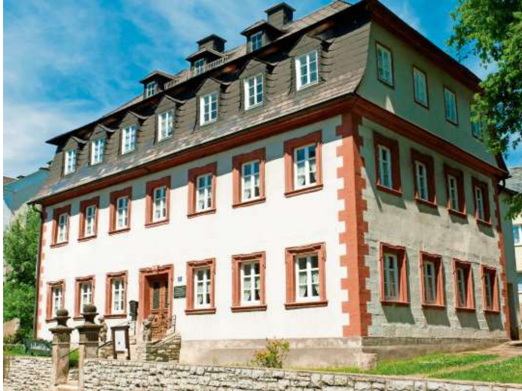
Den Spuren des Naturforschers Alexander-von-Humboldt folgt eine Halbtagesexkursion mit Werner Rost am 27. September. Das Foto zeigt sein ehemaliges Wohnhaus in Bad Steben.

Dauer: 3 x donnerstags, 18:15 Uhr – 19:00 Uhr