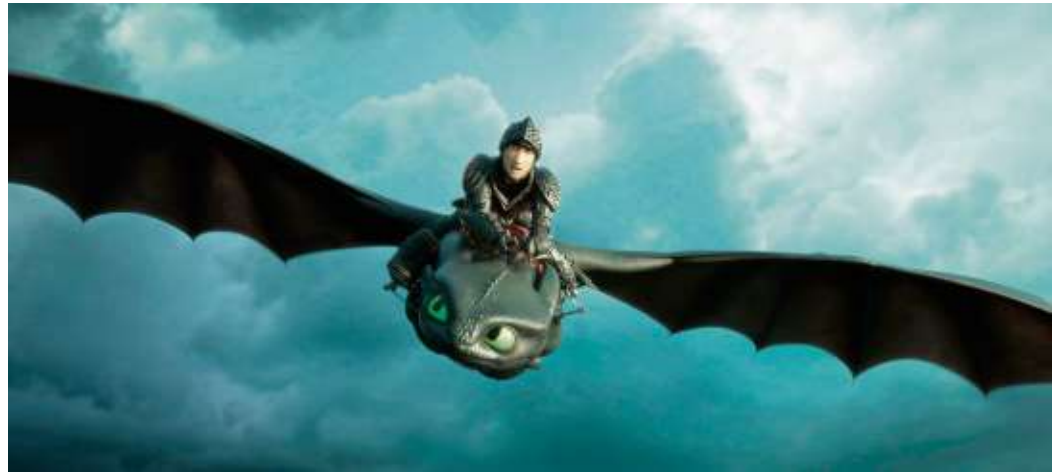
Szenen aus „Drachenzähmen leicht gemacht, Teil 3 und Teil 2 (Foto unten). Am 25. September wird der erste Teil beim Kinderkino im Gemeindehaus gezeigt.

Kinderkino am 25. September im Gemeindehaus