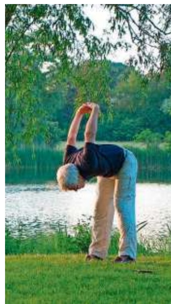
Gezielte Übungen für den Rücken und Kräftigung der Muskulatur wird im Kurs „Rückhalt“ gezeigt.

Wirbelsäulengymnastik, Haltungsschulung mit Korrektur. Mit Hilfe funktioneller Gymnastik, Dehnungs- und Spannungselementen wird Ihre Muskulatur gedehnt und gekräftigt. Trainingsprogramme für Zuhause, Korrektur von Fehlhaltungen, Beratung für den Alltag und das Berufsleben. Teilnehmer mit akuten Beschwerden werden gebeten, vorher einen Arzt zu