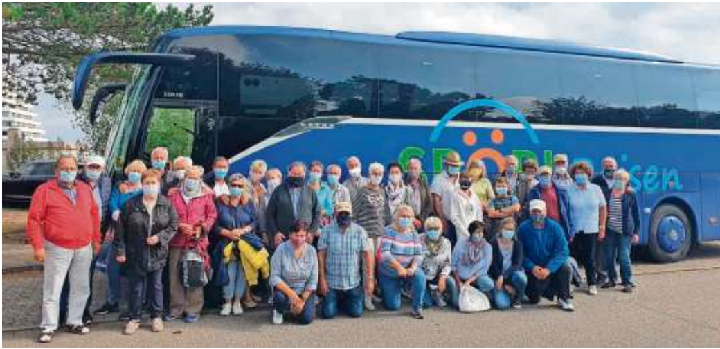
Die Teilnehmer der Reisegruppe Edelweiss Gemeinreuth der Urlaubsreise an die Ostsee.