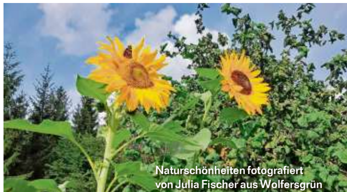
Naturschönheiten fotografiert von Julia Fischer aus Wolfersgrün

Die WIR-Redaktion bedankt sich für die vielen beeindruckenden Bilder, die Sie uns an die E-Mail-Adresse redfrankenwald@kurier.de schicken. Auf dieser Seite präsentieren wir einige der Bilder, die es bislang noch nicht ins Blatt geschafft haben.