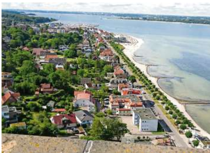
Blick vom Marineehrenndenkmal in Richtung Süden auf Laboe und die Kieler Förde

Schwarzenbach a.Wald - Auch in Zeiten der Corona-Pandemie ließ es sich die Reisegruppe nicht nehmen, ihren alljährlichen Ausflug zu unternehmen. Natürlich unter Beachtung aller Hygienevorschriften, die gewissenhaft eingehalten wurden. Ausgangspunkt für schöne Tagesausflüge war das Hotel „Zum Grünen Jäger“ in Gremersdorf, unweit vom Seebad Heiligenhafen entfernt. Die Tagesausflüge führten durch die Holsteinische Schweiz zum Ostseeheilbad Laboe, die Sonnenseite der Kieler Förde.