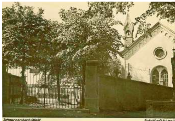
Schwarzenbach a. Wald Friedhofskapelle