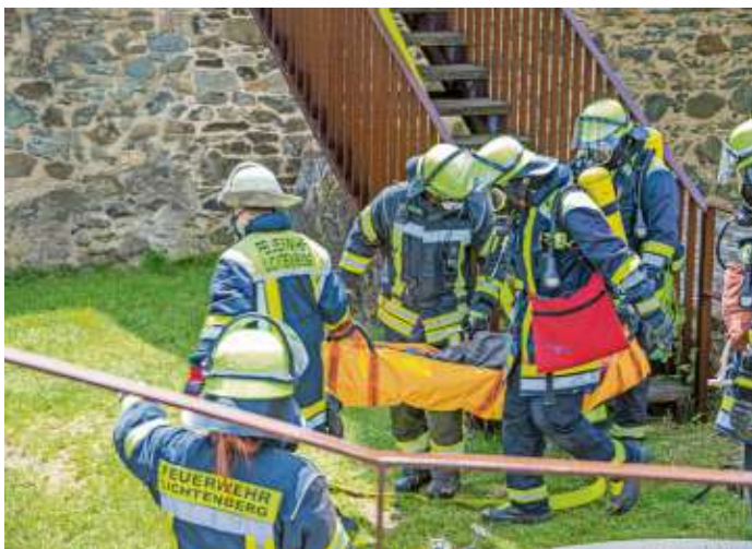
Die Atemschutzgeräteträger mussten die Person aus dem engen Turm mit einem Tragetuch retten.