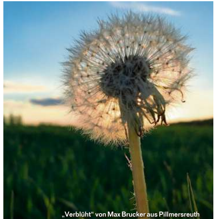
„Verblüht“ von Max Brucker aus Pillmersreuth