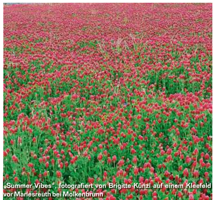
„Summer Vibes“, fotografiert von Brigitte Künzl auf einem Kleefeld vor Marlesreuth bei Molkenbrunn