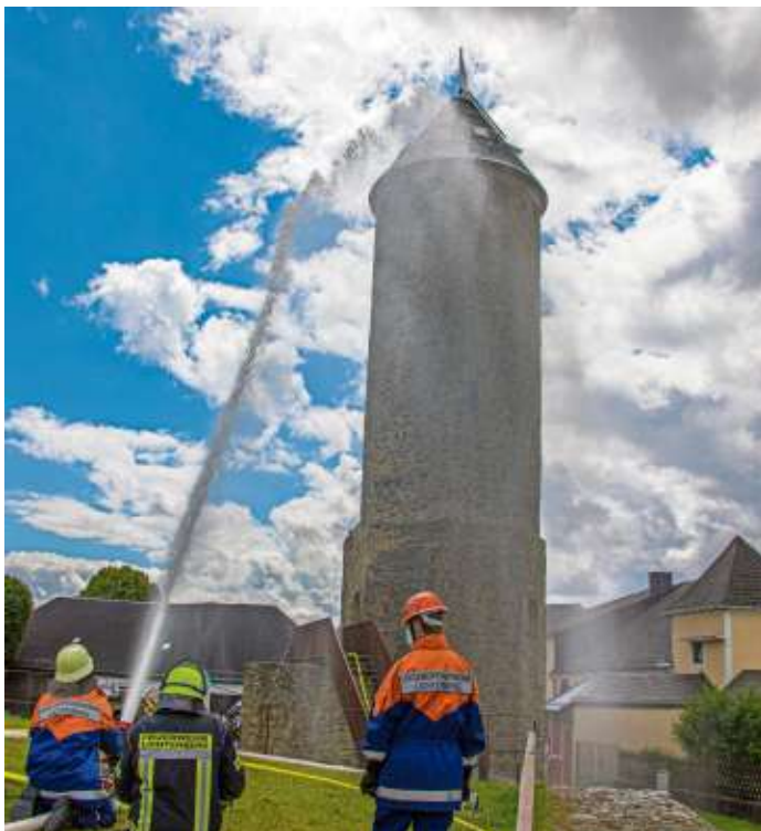
Ein Löschtrupp bekämpfte den Brand von außen mit einem mobilen Wasserwerfer.