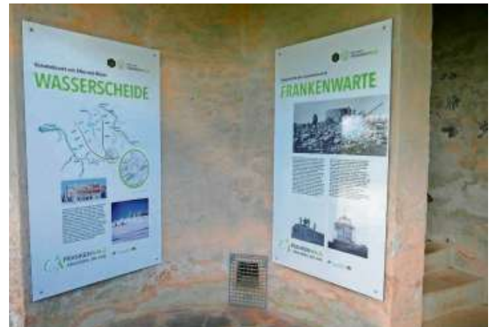
Panoramatafeln an den „Fensteröffnungen“ erläutern, was zu sehen ist.