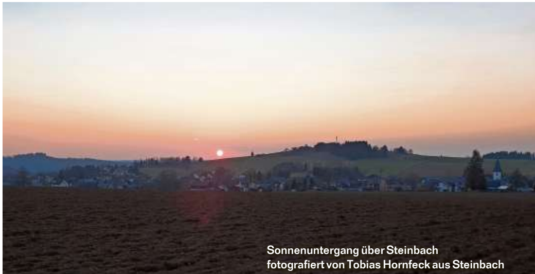
Sonnenuntergang über Steinbach

Die WIR-Redaktion bedankt sich für die vielen beeindruckenden Bilder, die Sie uns an die E-Mail-Adresse redfrankenwald@kurier.de schicken. Auf dieser Seite präsentieren wir einige der Bilder, die es bislang noch nicht ins Blatt geschafft haben.