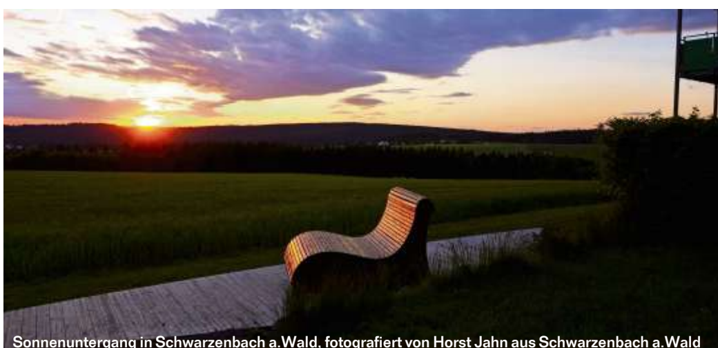
Sonnenuntergang in Schwarzenbach a. Wald