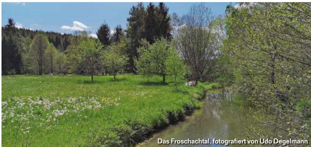
Das Froschachtal