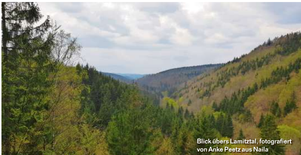
Blick übers Lamitztal, fotografiert von Anke Peetz aus Naila